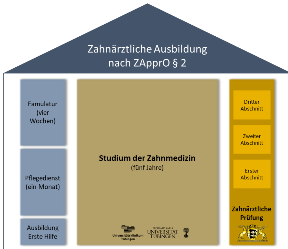
Abbildung 1: Die Zahnärztliche Ausbildung nach ZAprO § 2 umfasst (1) ein Studium der Zahnmedizin an einer Universität in einem Umfang von 5 000 Stunden und mit einer Dauer von fünf Jahren und einem zusätzlichen Examenssemester, (2) eine Ausbildung in erster Hilfe, (3) einen Pflegedienst von einem Monat, (4) eine Famulatur von vier Wochen und (5) die Zahnärztliche Prüfung. Die Zahnärztliche Prüfung besteht aus drei Abschnitten.

Da die Vorgaben der ZAprO bundesweit gelten, wird sichergestellt, dass die Zahnärztliche Ausbildung an den unterschiedlichen Standorten in Deutschland vergleichbar ist. Im Umfang und der Dauer orientiert sich die ZAprO auch an Ausbildungsrichtlinien der Europäischen Union.