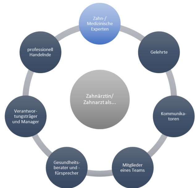
Abbildung 3: Die Rollen der Zahnärztin / des Zahnarztes

Der nationale kompetenzbasierte Lernzielkatalog Zahnmedizin (NKLZ) beschreibt Lern- und Ausbildungsziele, die im Zahnmedizinstudium bis zur Approbation lt. ZAprO zu erreichen sind. In einem mehrstufigen Modell bestehend aus den sieben professionellen Rollen, die Zahnärztinnen und Zahnärzte in der Ausübung ihres Berufs einnehmen müssen sowie unterschiedlichen Behandlungslässen und hierfür notwendigen Kompetenzen werden diese Lern- und Ausbildungsziele abgeleitet.