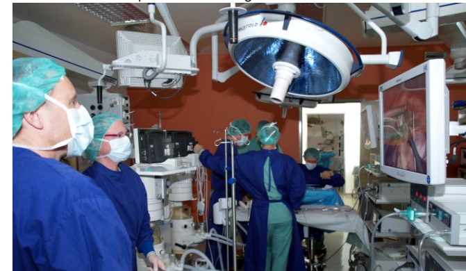
Hands-on-Workshop bei den MIC-Tagen 2011

Zertifizierung mit 19 Punkten bei der LÄK Baden-Württemberg beantragt