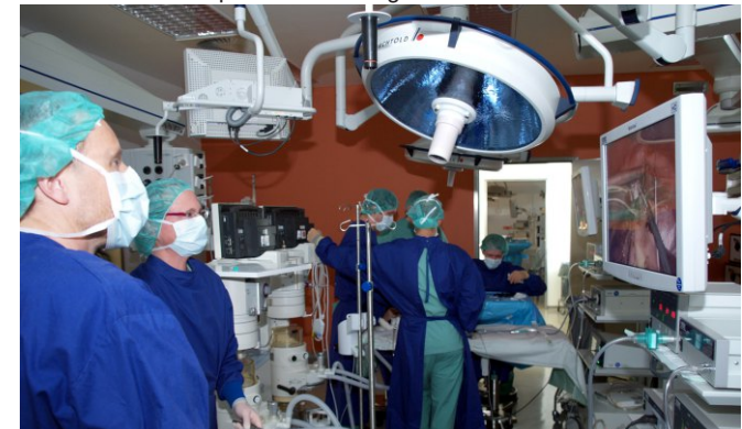
Hands-on-Workshop bei den MIC-Tagen

Zertifizierung mit 19 Punkten bei der LÄK Baden-Württemberg beantragt